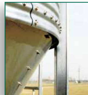
Borde de escurrimiento para desaguar la tolva cónica.