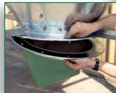
El acoplamiento del vertedero que tiene el anillo partido de VAL-CO permite una instalación rápida y fácil.